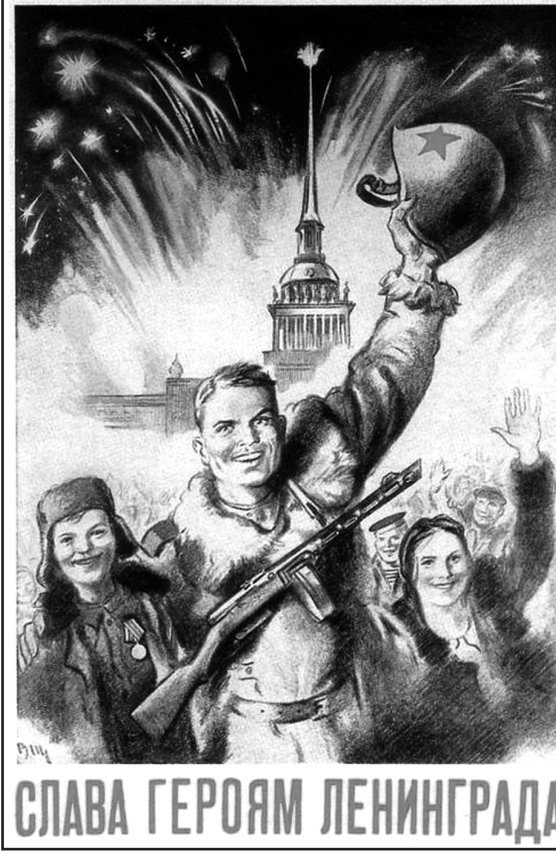
СЛАВА ГЕРОЯМ ЛЕНИНГРАДА!