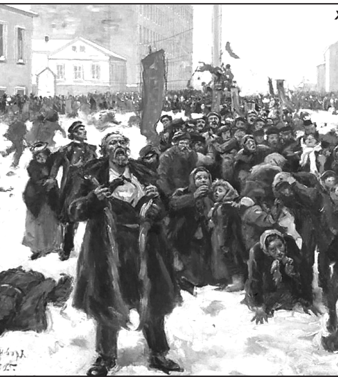
Худ. И.Е. Репин

Удивительное дело, но работа почтальона, оказывается, оценивается не было, здешним минимумом, почти что бурновским, пришлось искать спонсора. Спонсор нашёлся в последний момент. На просьбу пенсионерок откликнулся руководство районного... морга, они дали плавьям на наряды 5 тысяч рублей.